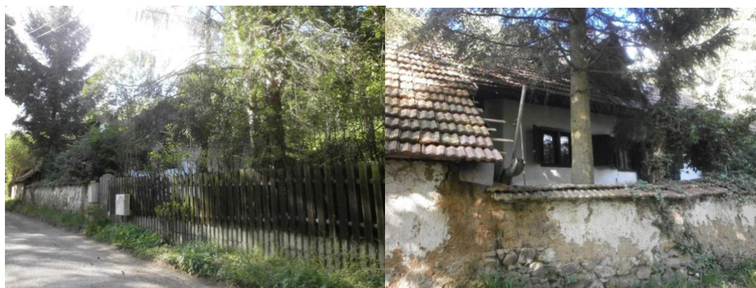
rodinný dom Schultzoovcov